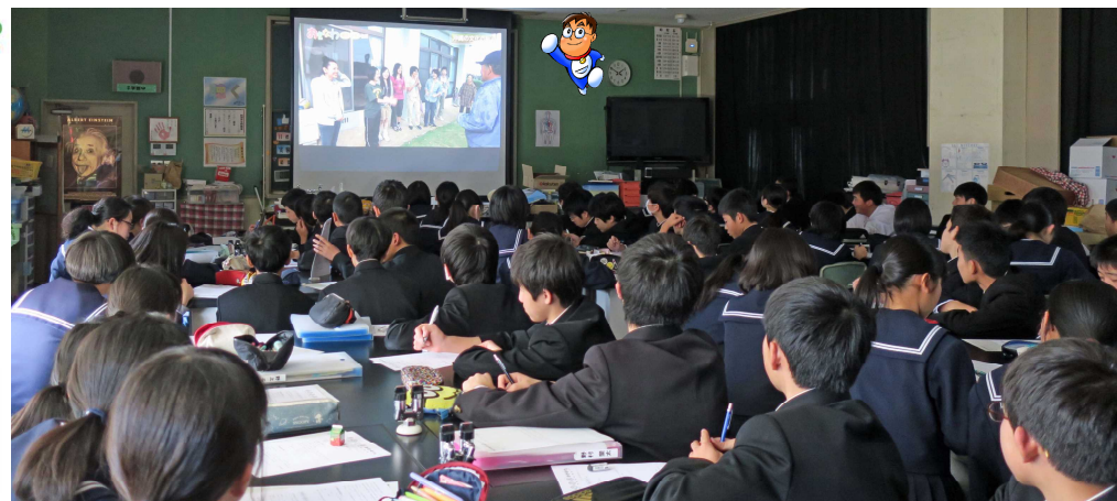
第1理科室の中は熱気でムンムン！とことん学んでウチナーで時間を有意義に使いましょ