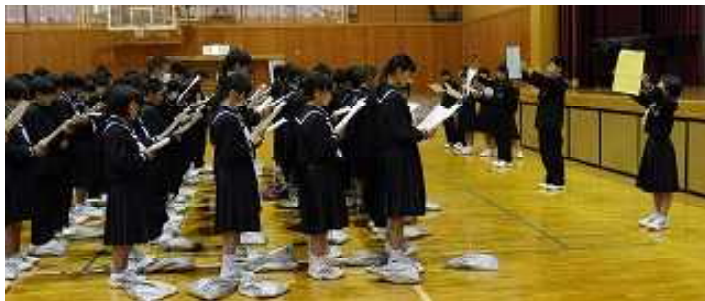
平和集会練習の様子

すでにお知らせしましたように、来る5月10日(金)・11日(土)に、2年生にとって最初の大きな行事である広島研修を実施します。この研修に向けて、平和学習や班別行動の計画などを進めてきました。現在、平和集会で群読する詩「ヒロシマ神話」の暗唱に全員で取り組んでいます。また10連休を控えて、しおりを製本し、クラスでしおり学習をしました。研修に必要な準備物などの用意を連休中に進めてください。