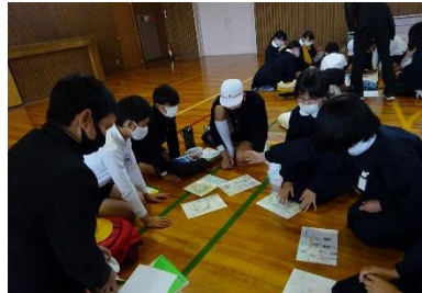
「将来の私と金光町」の交流