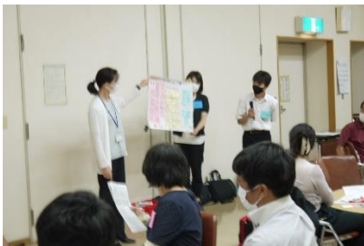
熟議の会 ワークショップ 「育とう！育てよう！金光の子どもたち」