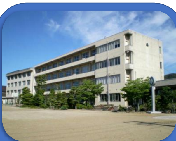
浅口市立金光中学校