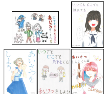
あいさつポスター