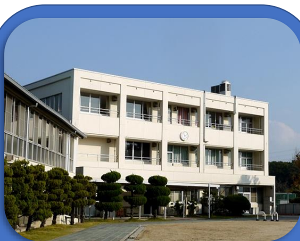
浅口市立金光竹小学校