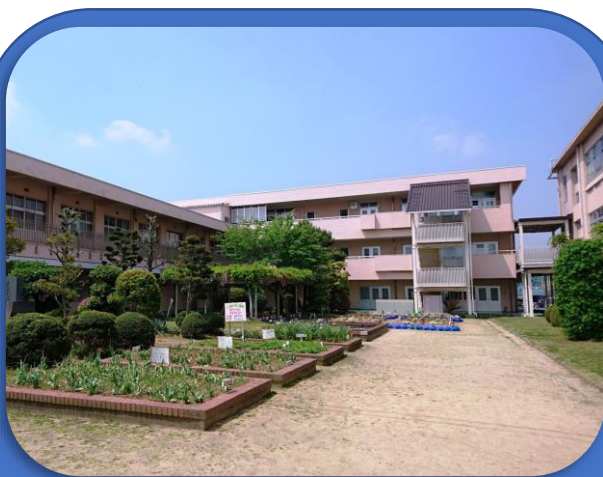
浅口市立金光小学校