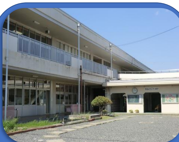
浅口市立金光吉備小学校