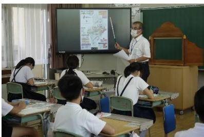
金光町には昔、大きな海 がありました！