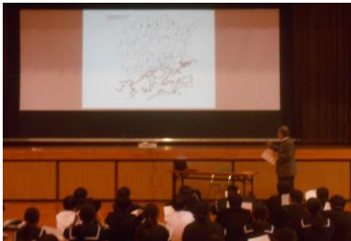
小中学校<縦の連携>