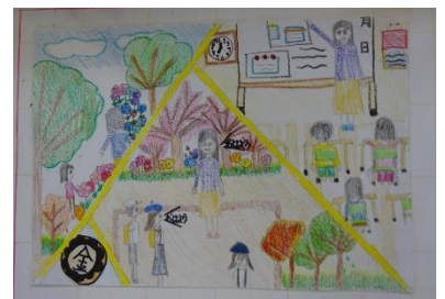
「将来の私と金光町」作品